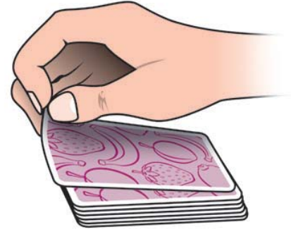
Bir kartın açılma şekli.

Oyuncu kendine bir avantaj sağlamamak için kartı karşı tarafa doğru açar, kendine doğru değil. Hareket ne kadar çabuk olursa kendisi de açılan kartı o kadar hızlı görebilir.